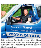
Interessant ist die Dienstleistung übrigens auch für private Hausbesitzer mit einer Solar- oder Photovoltaikanlage auf dem Dach. Denn Vater Staat fördert die Reinigung als haushaltsnahe Dienstleistung. Die Kosten sind somit steuerlich absetzbar.

„Paradiesen-Technik“ mineralisches Wasser und keine Chemie. „Wenn reines Wasser über die Oberflächen fließt, löst es alle vorhandenen Substanzen und hinterlässt nach gründlicher Spülung eine strahlende Oberfläche.“ Das hat physikalische Gründe. Ein Wasserstoffatom ist ein positiv geladenes Wasserstoffion. Das andere Atom ist gekoppelt ein das Sauerstoffatom und bildet so ein negativ geladenes Ion. Reines Wasser verbindet hingegen die Ionen und reingt somit die Flächen. Die Kosten der Reinigung sind nach Worten von Garrels überschaubar. Denn die Technik, die er einsetzt, ist äußerst effizient und zeitsparend.